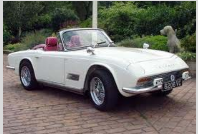
ZEST in zijn huidige originele toestand

In 1961 kreeg Triumph een kapitaalsinjectie door de fusie met British Leyland. Inmiddels was iedereen er zich van bewust dat de Vanguard 4cyl-motor de grens had bereikt van zijn ontwikkeling. Men zocht en vond een waardige motor in de Vanguard 2l-6cyl motor, die later in de GT6 en Vitesse zou worden gebruikt. In 1963 haalde men het project van 1957 terug uit de ijskast en Michelotti paste de koets aan voor montage op een chassis. Chassis nummer X684 kreeg aldus een, 2l-6cyl motor onder de bonnet. De wagen werd ingeschreven als TR4-prototype ZEST -6cyl-LHD-2l-Styling studio, Italian, onder het nr 6206VC. Iedereen was tevreden, behalve de Amerikanen... te lage bumpers en opklapbare lichten waren verboden (een jaar later mochten ze wel!!). Terug naar af... Michelotti had te veel met andere projecten om handen en alles werd